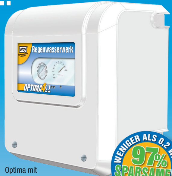
Optima mit Abdeckhaube