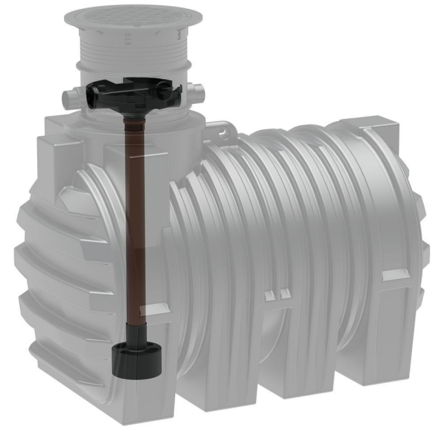
detail A connection area Anschlussfläche

* Additional equipment required Technical developments and changes in individual items, as well as errors, misprint and price alterations reserved. Photos and drawings are nonbinding. Depending on the technology, minor dimensions, weight and color variations may occur. * optionales Zubehör erforderlich Technische Weiterentwicklungen und Änderungen der einzelnen Artikel, sowie Irrtümer, Druckfehler und Preisänderungen vorbehalten. Fotos und Zeichnungen sind unverbindlich. Technologisch bedingt können geringfügige Maß-, Gewichts- und Farbabweichungen auftreten.